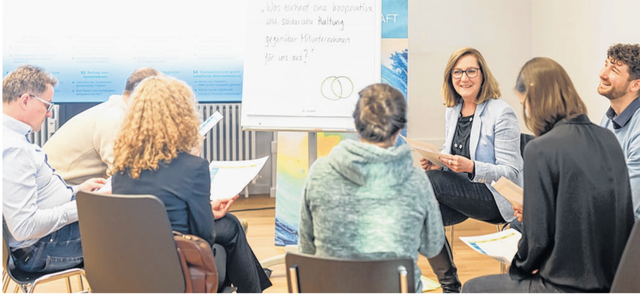
In der Gruppe wird über das Thema Nachhaltigkeit diskutiert.